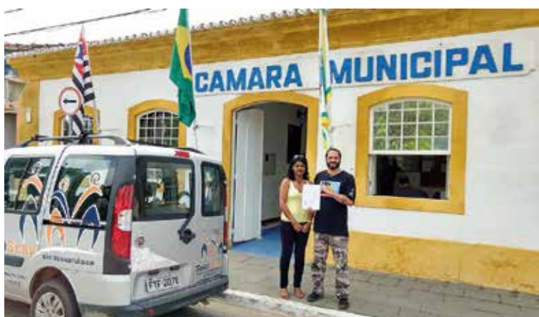
Documento elaborado pela Comissão foi protocolado na Câmara e na Prefeitura junto a um pedido de reunião para apresentação das propostas de alteração no PL